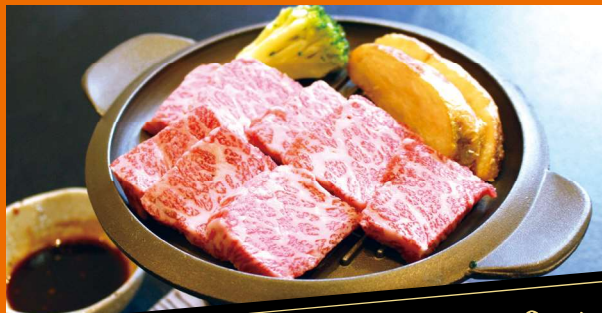
特選牛ステーキ 2,420円 (税抜2,200円)