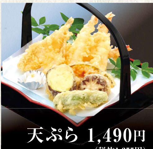
天ぷら 1,490円 (税抜1,355円)