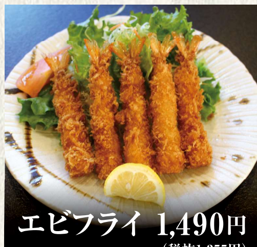
エビフライ 1,490円 (税抜1,355円)