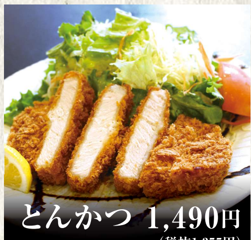
とんかつ 1,490円 (税抜1,355円)